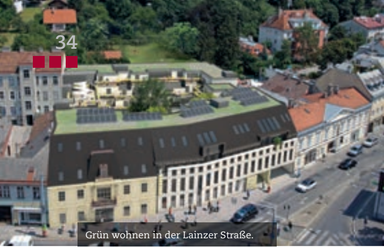
Grün wohnen in der Lainzer Straße.