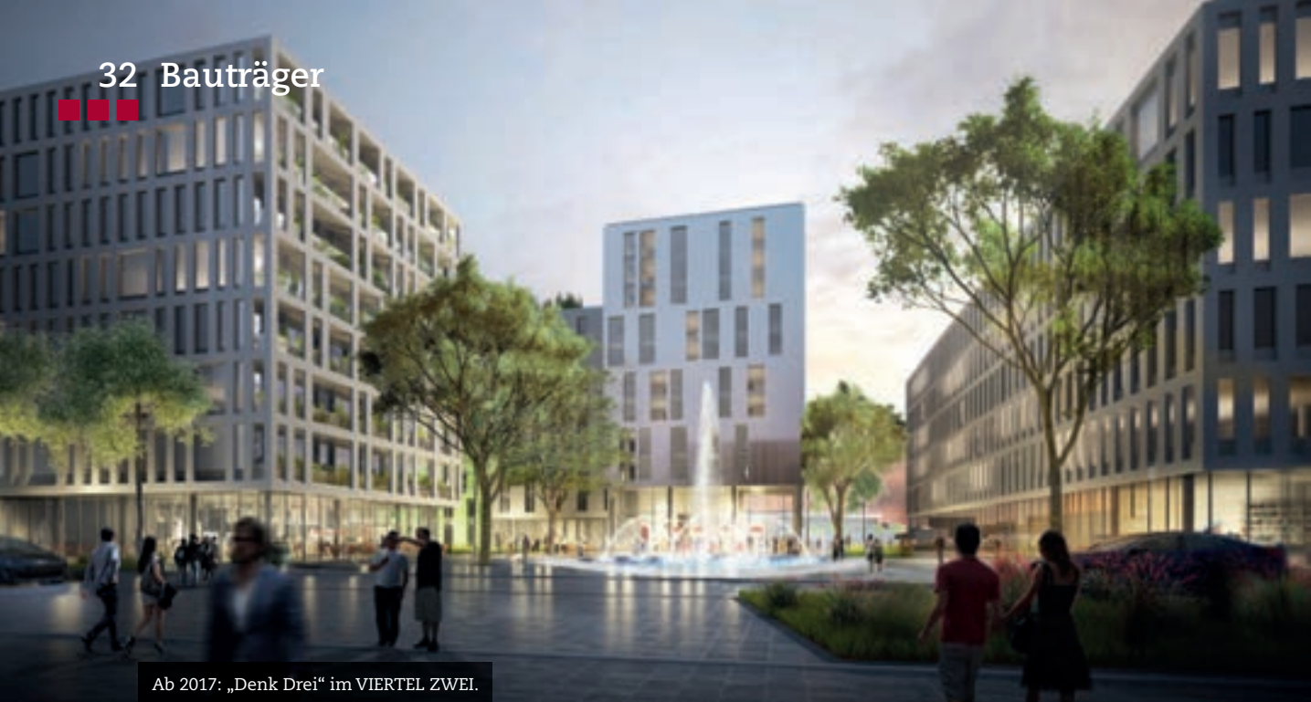
Ab 2017: „Denk Drei“ im VIERTEL ZWEI.