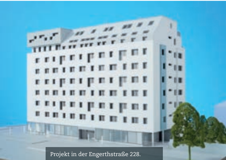
Projekt in der Engerthstraße 228.

haus und „Ars Electronica“-Center – alle liegen in Gehdistanz zum geschichtsträchtigen Gebäude.